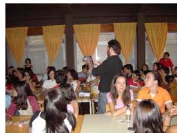
Figura 6 – Workshop de vídeo con los alumnos de la Escola Secundária

En su desarrollo, los alumnos empezaron por realizar un workshop de vídeo, participaron en sesiones de discusión con el colectivo sobre los temas implicados [Fig. 6], acompañaron y participaron en la producción de la película y expresaron sus ideas sobre la problemática a través de dibujos, que como ya referimos se enseñaron al día del ante estreno de “ Linhas Paralelas ”, en la Estación de Ferrocarriles de Vila Viçosa [Figura 7, Figura 8 y Figura 9].