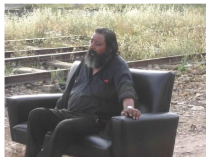
Figura 4 – El sofá durante las filmagens en la Estación de Vila Viçosa.