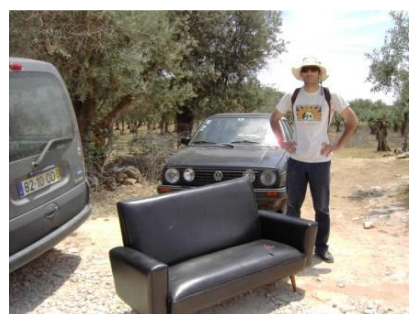
Figura 5 – Uno elemento del OSU y el sofá en un camino de canteras para filmar uno antiguo trabajador siendo entrevistado para la película (cerca de Bencatel – Vila Viçosa)