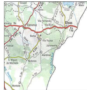
Figura 1 - Localización geográfica del eje Estremoz Vila Viçosa en mapa de Portugal

“ Linhas Paralelas ” (trad. al cast. Líneas Paralelas) es el último corto-metraje realizado por el Colectivo OSU en el año de 2005. Presentada en Fantasporto 2006, había estrenado el 1 de Agosto del mismo año en la Estación de Ferrocarriles de Vila Viçosa 1 en la cual se ha exhibido también una exposición de dibujos de los alumnos de la Escola Secundária Pública Hortênsia de Castro, realizados en el contexto de las actividades y acciones desarrolladas a lo largo de la producción de la película, en Alentejo [Fig. 1].