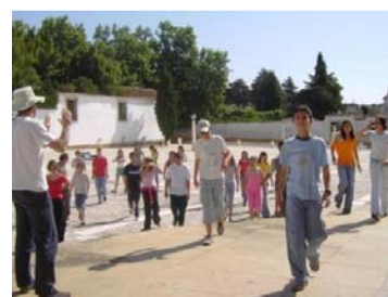
Figura 8 -- Momento con los alumnos y elementos del OSU, durante la producción de la película en la plaza del Palacio Ducal de Vila Viçosa

La película “ Linhas Paralelas ”, asume una perspectiva fundamentada en la importancia de la dimensión biográfica en la constitución del discurso, la importancia política de la biografía, que nos podrá encaminar para nuevos paradigmas de la educación.