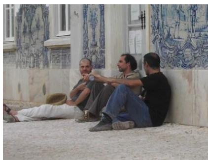
Figura 10 – Elementos del OSU en un momento de descanso de las filmagens en la antigua zona de embarque de la Estación de Ferrocarriles de Vila Viçosa

En Portugal, lo diálogo entre el arte y otros ámbitos de acción no tiene una historia continuada como en otros países. Características políticas, históricas y geográficas muy particulares resultaren en que las prácticas artísticas de las que estamos hablando han sido experimentadas de una forma muy específica y discontinua.